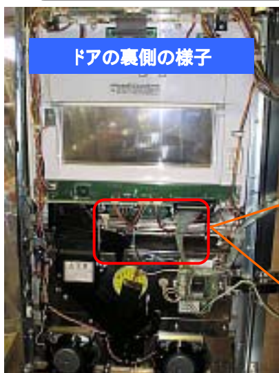
ドアの裏側の様子