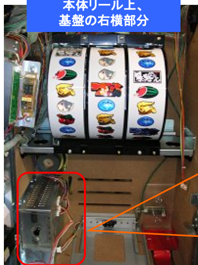
本体リール上、 基盤の右横部分