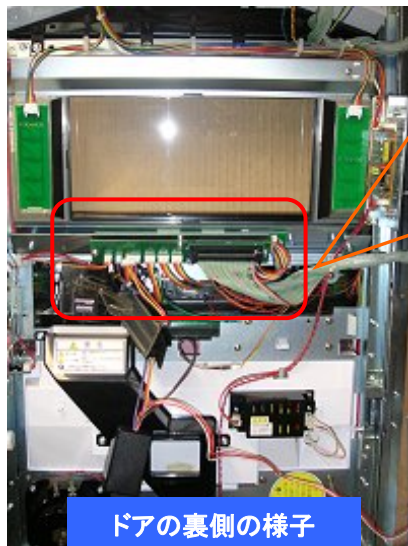
ドアの裏側の様子