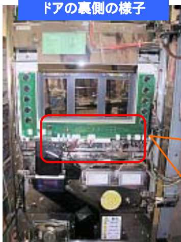
ドアの裏側の様子